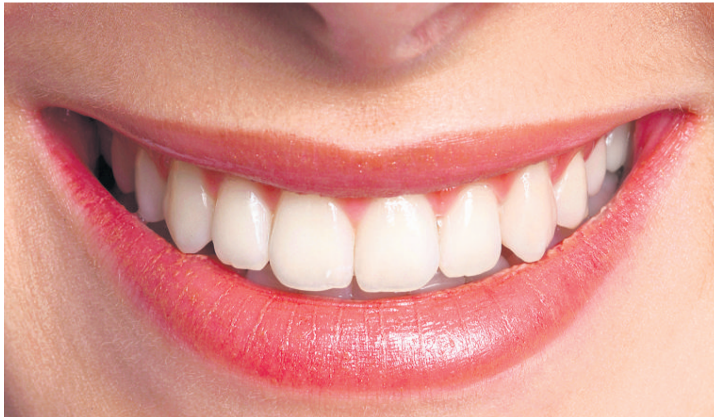
Brossage régulier, fil dentaire et solution buccale restent les meilleurs garants d'une dentition saine.

A la télévision, au moment de la coupure pub, ce n'est plus de la margarine étalée sur du pain que l'on fait essayer aux passants, mais un dentifrice pour dents sensibilisées. Un petit brossage et hop, les testeurs ravis avalent tout sourire un grand verre d'eau glacée! Et comme par magie, ils ne sentent plus rien. Il y a aussi ce bain de bouche antibactérien qui promet de désinfecter toute la cavité buccale, contrairement à la brosse à dents qui ne nettoierait que 25% de la bouche... Pas facile de différencier le marketing et la vérité. Le point avec l'hygiéniste dentaire indépendante Florianne Perrenoud, à Lausanne.